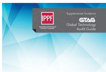
Основи на информационните технологии за вътрешни одитори

В края на м. юни 2020 г. бе преведен и разпространен безплатно до членовете на ИВОБ актуализирания модел на "Трите линии на защита" на Глобалния институт на вътрешните одитори (The IIA). Моделът на трите линии помага на организациите да идентифицират структури и процеси, които най-добре подпомагат постигането на целите и допринасят за стабилно корпоративно управление и управление на риска.